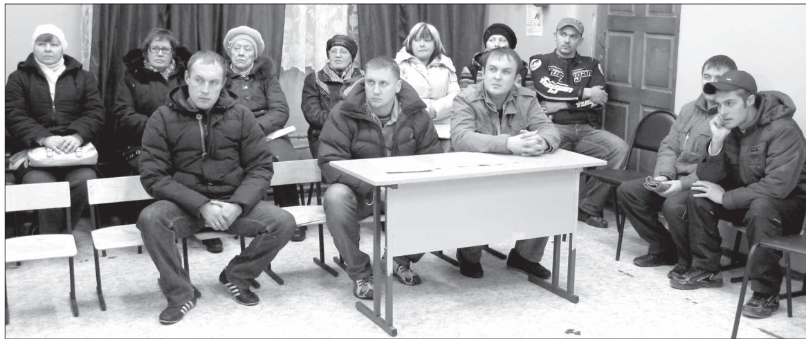
Собрание по созданию ТОСа проходит при активном участии жителей.

«Наша Вологда» писала о том празднике, каким стало откры-